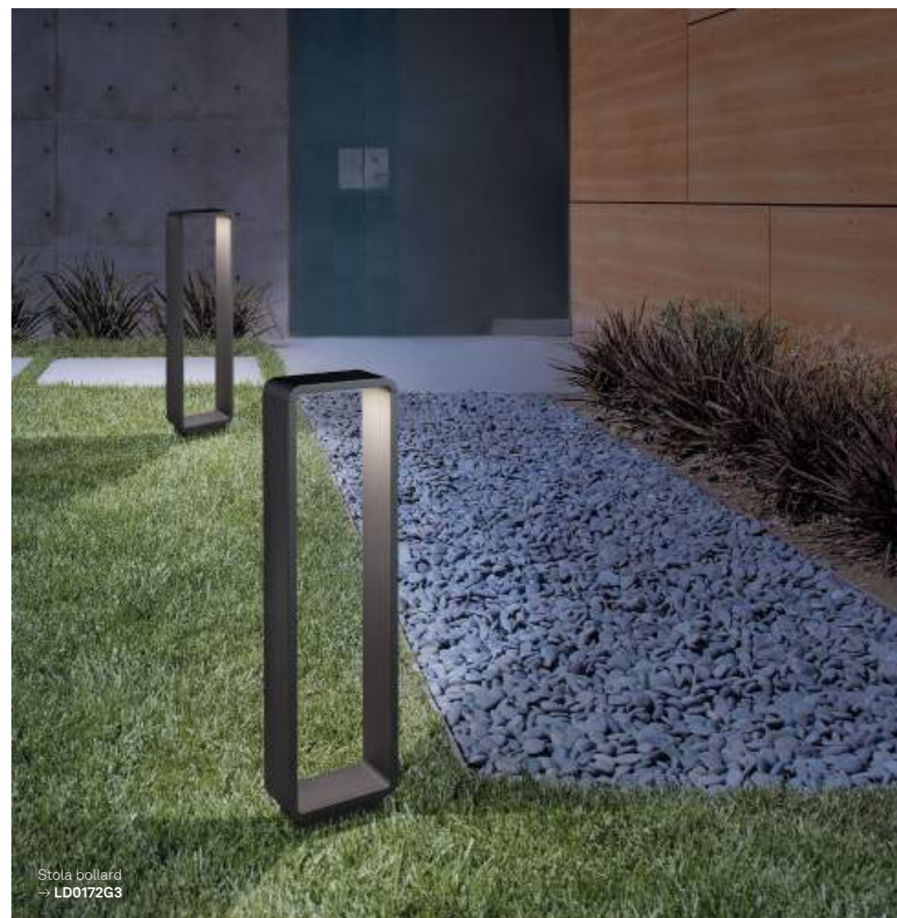
Stola bollard → LD0172G3

Modalità di installazioni differenti da quelle illustrate sono da ritenersi non idonee. Installation procedures other than those illustrated are considered unsuitable.