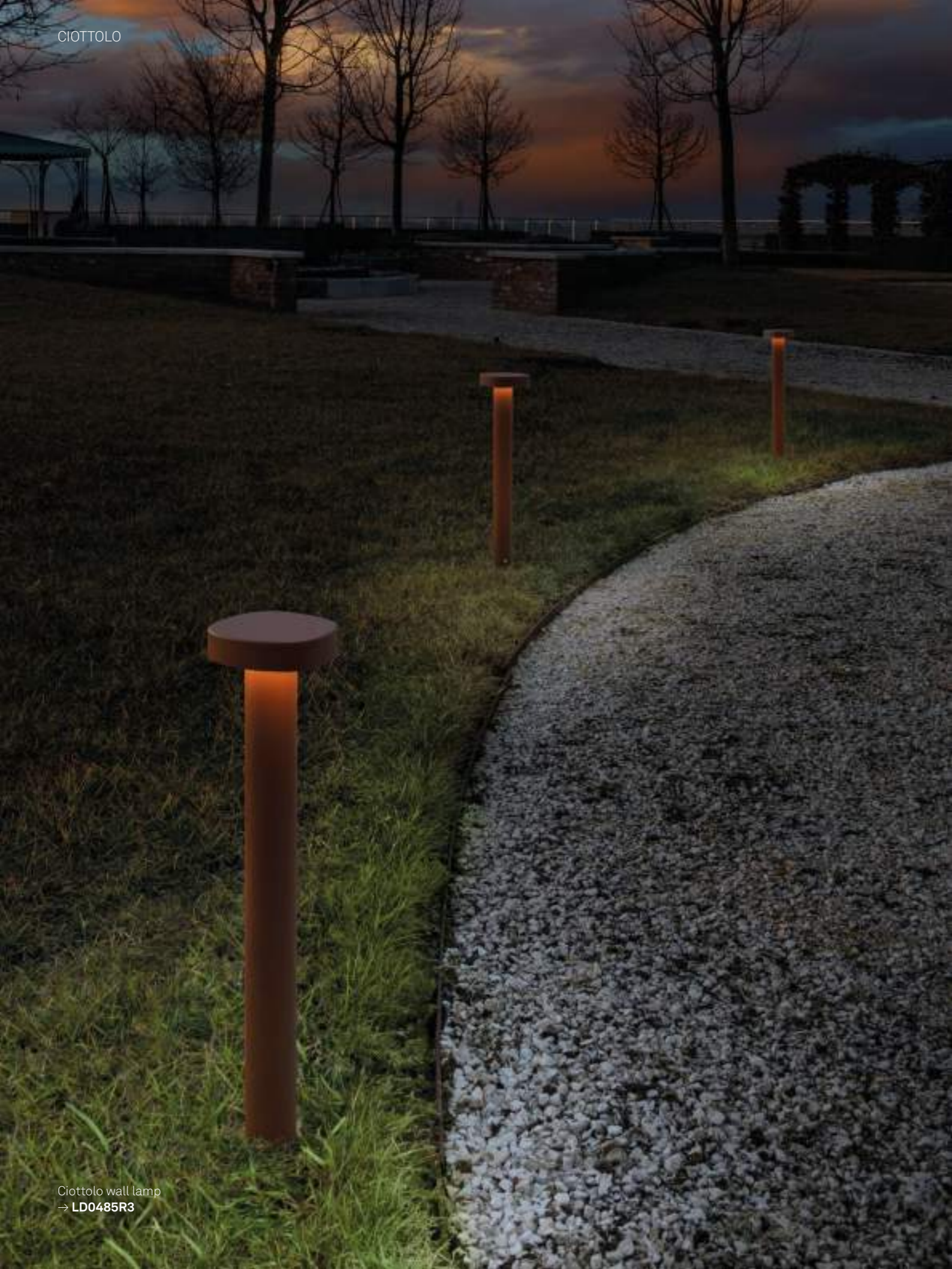
Ciottolo wall lamp → LD0485R3