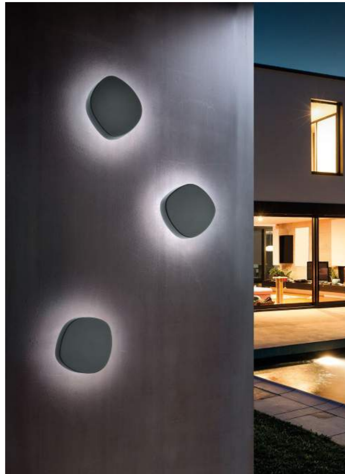
Ciottolo wall lamp → LD0480G3

Wall lamps and bollard with a dark gray or corten painted die-cast aluminium frame and a satin-finish opaline polycarbonate diffuser. The high IP rating (IP54) makes the lamps ideal for indoor and outdoor use.